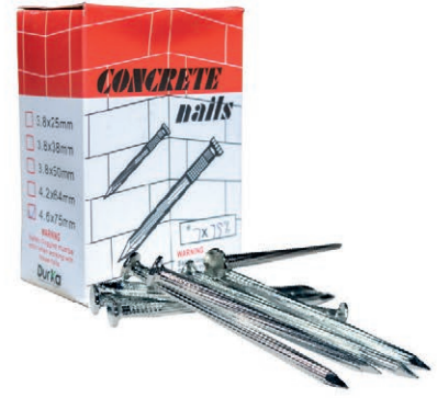
CLAVO ACERO JAPAN 3" (7*75) DK CJ/500G 03V.CA3