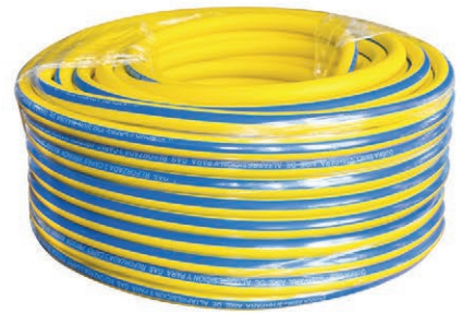
MANG/CAUC AMARILLA 5/16-390PSI (50MTRS)(DK) 02.MCAA16-50