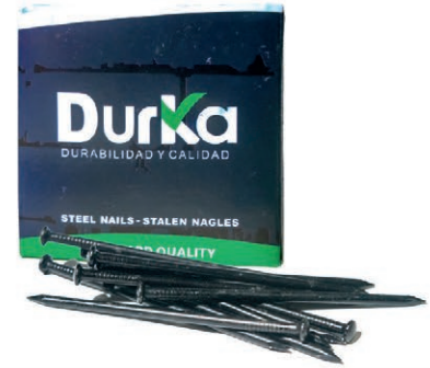
CLAVO ACERO NEGRO 2*2.5 DK CJ-100PZA 03V.CAN2