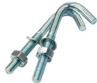
GANCHO J C/T 1/4 * 5 DK (F-100) 06E.A.J512