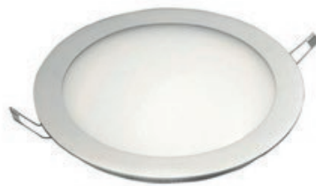
PANEL LED REDONDO EMPOTR 12W