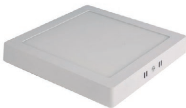
PANEL LED CUADRADO SOBREP 18W