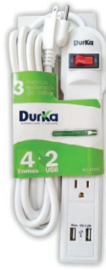
REGLETA DURKA 4 SERV + 2 USB (XH-1104C) 05T.RDK4S2U