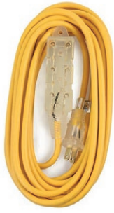
EXTENSIÓN BANANA DE 3 MT