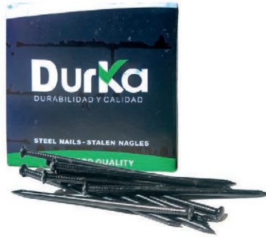
CLAVO ACERO NEGRO 1 1/2*2.5 DK CJ-100PZA 03V.CAN112