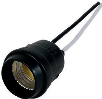
BOQUILLA DE CAUCHO 05B.CATW