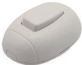
INTERRUPTOR SOBREPUESTO CON TAPA 05T.TWIS