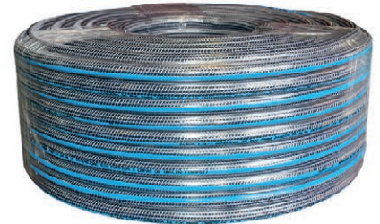
MANG/JARDIN NYLON/NEGRA ½" 100 MET (DK) 02.MJNN12