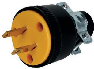
ENCHUFE DE CAUCHO DE 2 PATAS 05E.TEC2