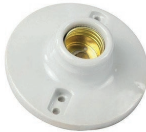
PLAFÓN DE CERÁMICA 05B.PLLOG