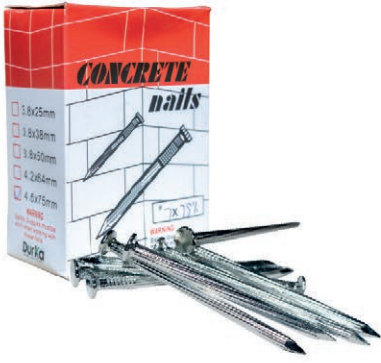
CLAVO ACERO JAPAN 2" (9*50) DK CJ/500G 03V.CA2