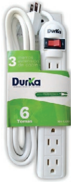
REGLETA DURKA 6 SERV.(XH-1306A) 05T.RDK6S