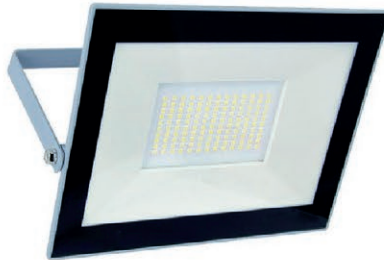
REFLECTOR LED 200W-110V IP65 05R.DKL200W