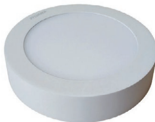
PANEL LED REDONDO SOBREP 12W