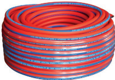
MANG/CAUC ROJA 5/16 - 450PSI (50MTRS) (DK) 02.MCR516