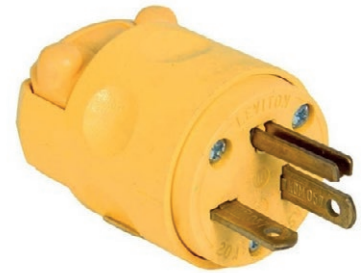
ENCHUFE INDUSTRIAL TRIPLE 05E.DKET