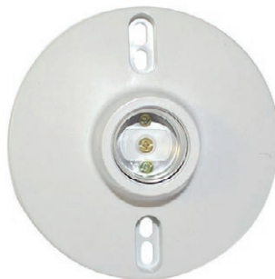
PLAFÓN PLÁSTICO 05B.DKPLP