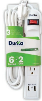
REGLETA DURKA 6 SERV + 2 USB (XH-1106C) 05T.RDK6S2U