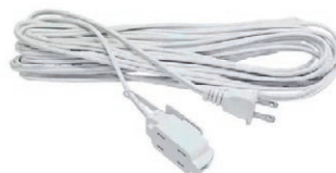
EXTENSION 7MT BL-2*16 05C.DKE7M