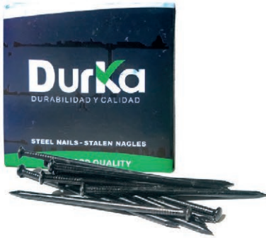
CLAVO ACERO NEGRO 1*2.5 DK CJ-100PZA 03V.CAN1