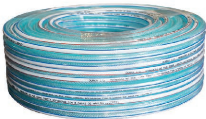
MANG/JARDIN NYLON/TRANSPA ½" 100 MET (DK) 02.MJNT12