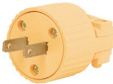
ENCHUFE INDUSTRIAL DOBLE 05E.DKED