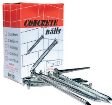
CLAVO ACERO JAPAN 1" (9*25) DK CJ/500G 03V.CA1