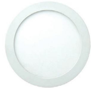
PANEL LED REDONDO EMPOTR 18W