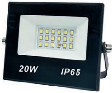
REFLECTOR LED 20W-110V IP65 05R.DKL20W