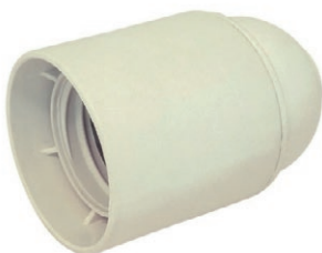
BOQUILLA BAQUELITA BEIGE 05B.DKBEB