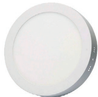
PANEL LED REDONDO SOBREP 18W