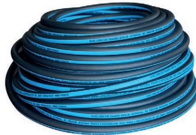
MANG/CAUC NEGRA 5/16 - 580PSI (50MTRS) (DK) 02.MCN516