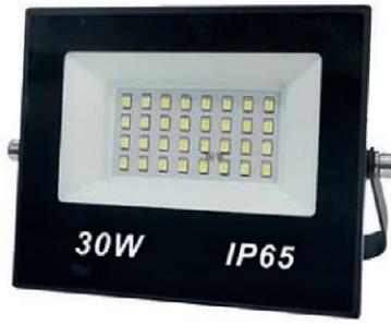
REFLECTOR LED 30W-110V IP65 05R.DKL30W