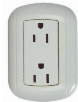
TOMA DOB SOBREPUESTO BLANCO 05E.DKTDSB