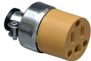
TOMA AEREA BLIND 05E.DKTAB