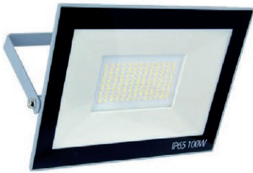
REFLECTOR LED 100W-110V IP65 05R.DKL100W