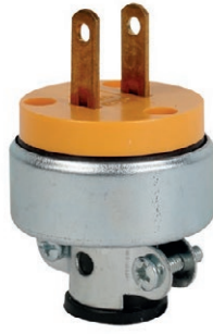
ENCHUFE BLINDADO DE 2 PATAS 05E.TE2