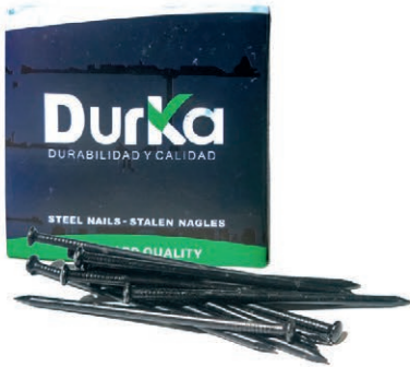
CLAVO ACERO NEGRO 2-1/2 * 2.5 DK CJ-100PZA 03V.CAN212