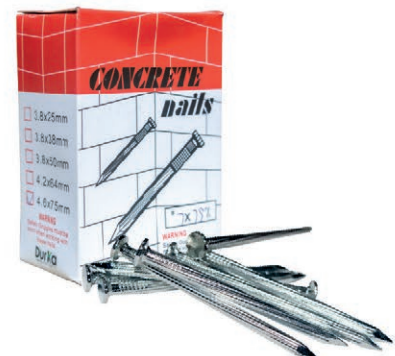
CLAVO ACERO JAPAN 1½" (9*38) DK CJ/500G 03V.CA112