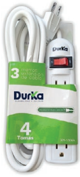
REGLETA DURKA 4 SERV. (XH-1304A) 05T.RDK4S