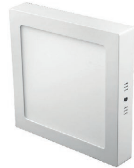
PANEL LED CUADRADO SOBREP 12W