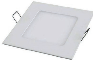
PANEL LED CUADRADO EMPOTR 18W