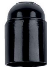
BOQUILLA PLÁSTICA 05B.BE