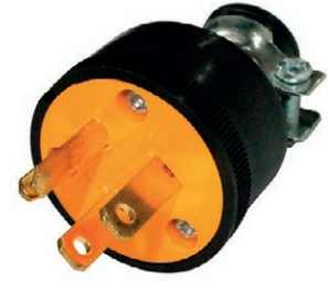
ENCHUFE DE CAUCHO DE 3 PATAS 05E.E3