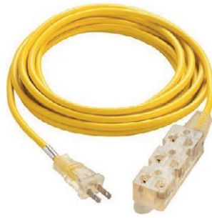
EXTENSIÓN BANANA DE 5 MT